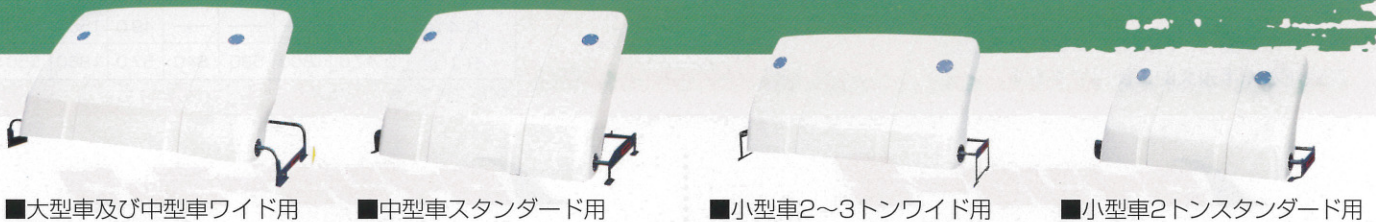
■大型車及び中型車ワイド用